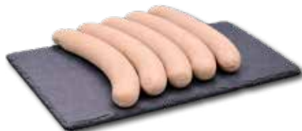
BRATWÜRSTEL Aktionspreis pro 100 g dick € 1,39