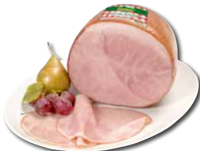
GOURMETSCHINKEN Aktionspreis pro 100 g € 2,49