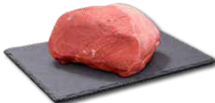
SCHALE Aktionspreis pro 100 g von der Kalbin € 2,79