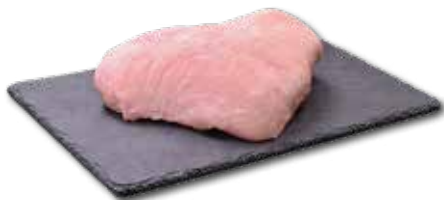
SCHALE Aktionspreis pro 100 g vom Duroc Schwein € 1,39